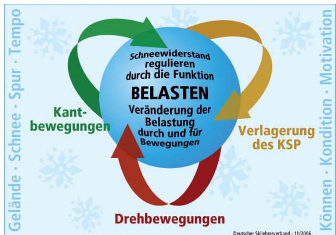
Deutscher Skilehrverband - 11/2006

Optimale Kurvenqualität für jede Situation, mit Leichtigkeit bewegen, funktionell fahren – das ist unsere Zielsetzung. Aber wie kann ich diese Zielsetzung realisieren, oder wie kann ich diese Zielsetzung bei einem Schüler erreichen? Wesentliche Bewegungsmerkmale, die wir bei allen überdurchschnittlich guten Skifahrern, wie z.B. bei Rennläufern, bei Skilehrern oder extremen Geländefahrern beobachten können, und in allen Situationen Anwendung finden, helfen uns zu orientieren. Wir sprechen hier von den skitechnischen Merkmalen für hochwertiges Kurvenfahren.